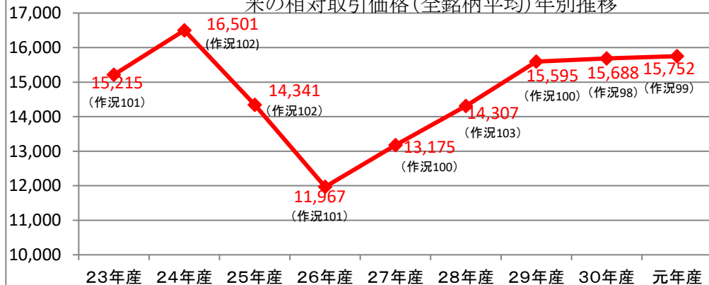
米の相対取引価格(全銘柄平均)年別推移

注: 価格は運賃・包装代を含む消費税税抜き価格(26年3月までは5%で割戻、4月からは8%で割戻)。